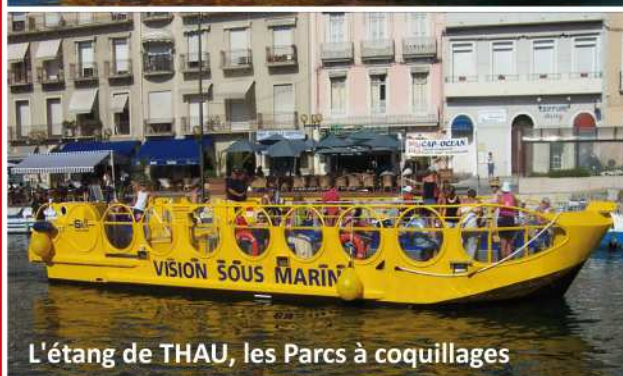
L'étang de THAU, les Parcs à coquillages