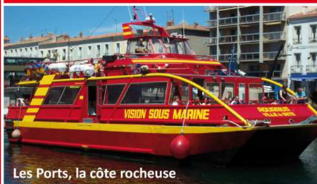
Les Ports, la côte rocheuse