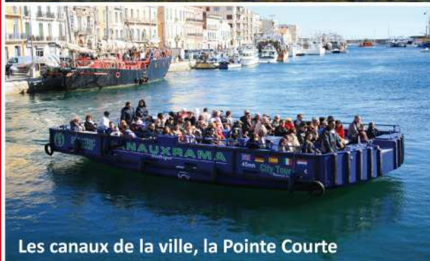
Les canaux de la ville, la Pointe Courte