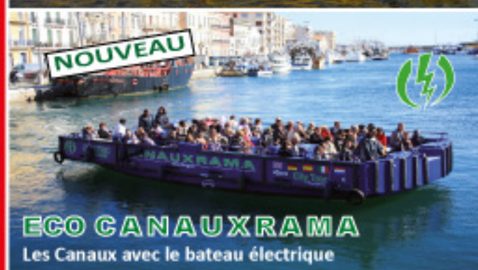
NOUVEAU ECO CANAUXRAMA Les Canaux avec le bateau électrique