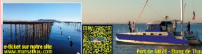
e-ticket sur notre site www.mansathau.com Port de MEZE - Etang de Thau