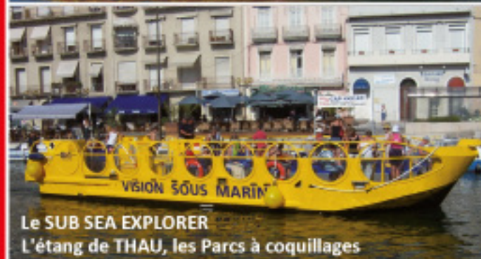
Le SUB SEA EXPLORER L'étang de THAU, les Parcs à coquillages