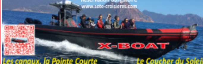
Les canaux, la Pointe Courte Le Coucher du Soleil

Vous allez voir les belles excursions à bord d'un bateau semi rigide de 12 mètres équipé de 2 moteurs de 150cv. Réservation obligatoire www.sete-croisieres.com