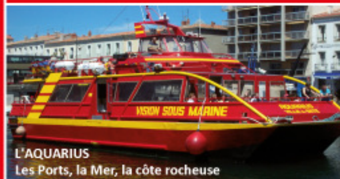
L'AQUARIUS Les Ports, la Mer, la côte rocheuse

Transports Maritimes de Passagers Depuis 1989